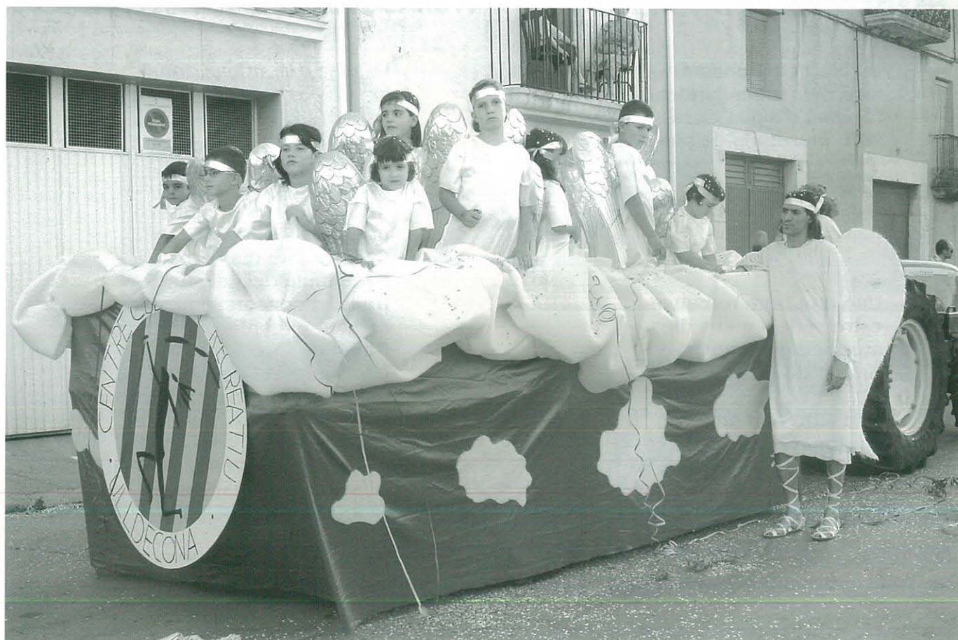
Carrossa del CCR a les Festes Majors d'aquest any